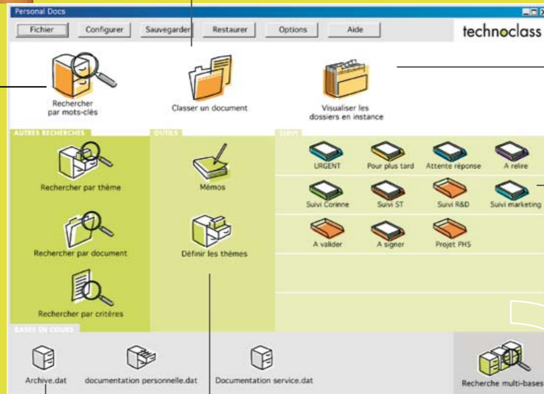
Le "bureau" Personal DOCS®

Personal DOCS® cherche et trouve quel que soit le mot-clé qui vous vient à l'esprit ou le critère dont vous avez besoin.